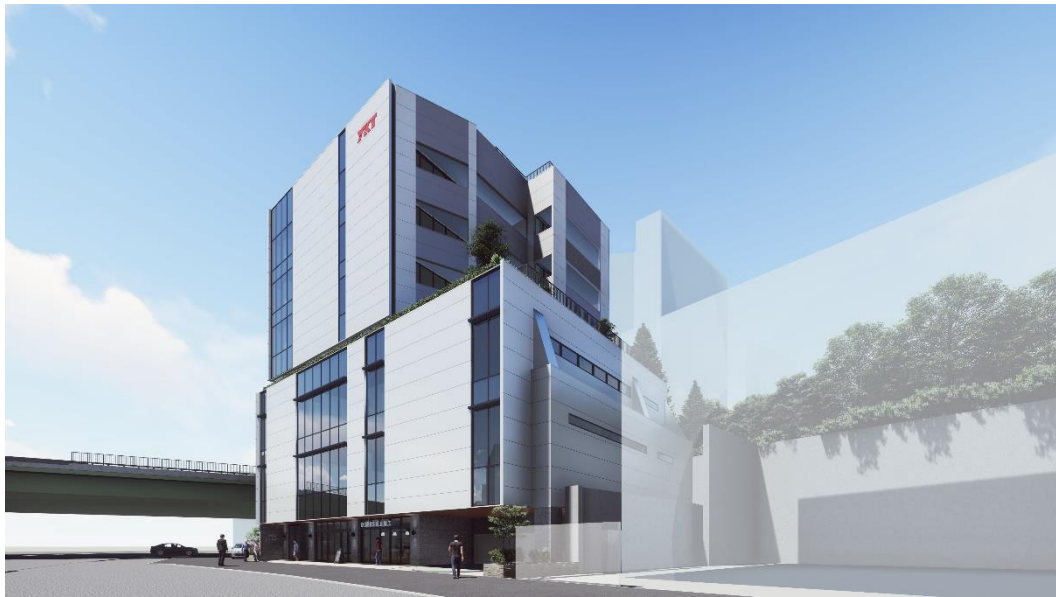
▲外観完成イメージ

公式WEBサイト： https://portalpoint.jp/yoyogi-koen/