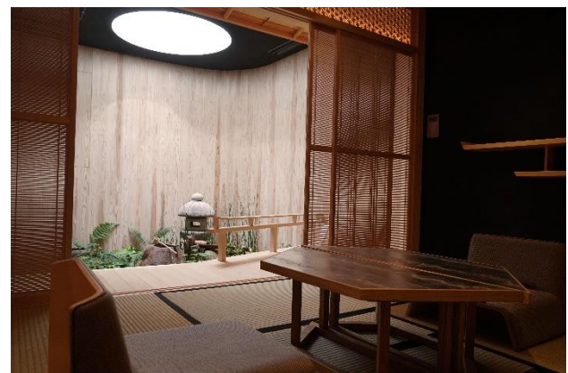
▲ドローイングルーム（レイアウト等は変更となる場合がございます。）