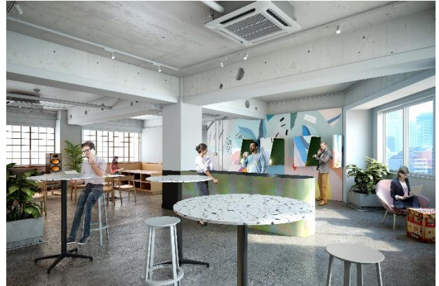
▲ラウンジイメージパース（レイアウト等は変更となる場合がございます。）