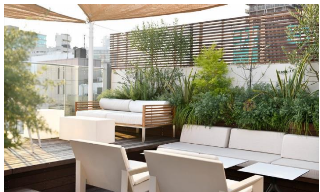
▲ルーフトップテラス（レイアウト等は変更となる場合がございます。）