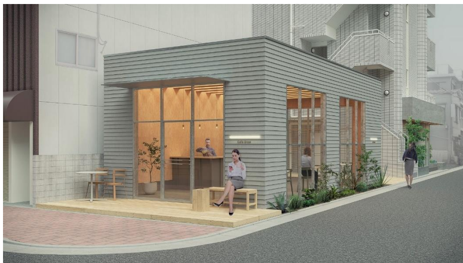
▲新築の飲食店舗イメージパース