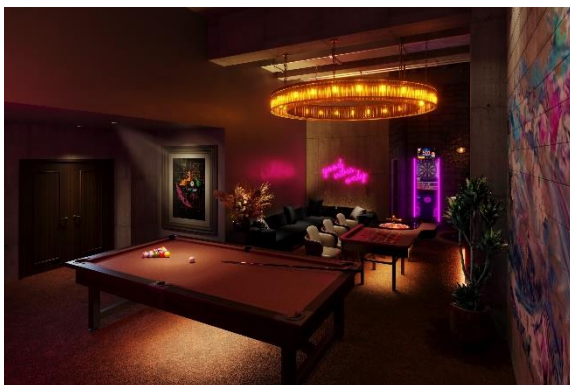
▲B1F Play Room イメージ