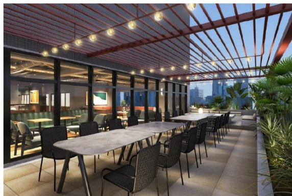
▲5F Terrace イメージ