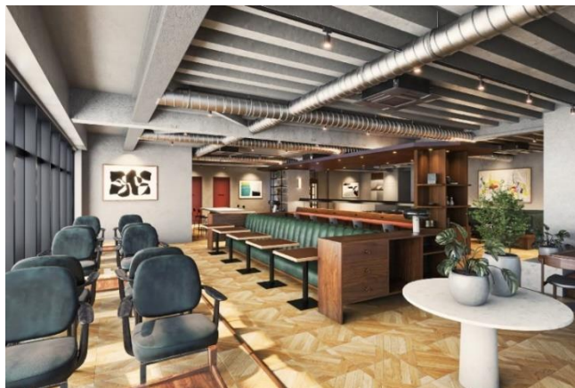
▲5F Lounge イメージ

多様な共用部をフル活用し、企業規模に関わらない交流促進や施設内で拡大移転もできる長期的な活動拠点として、腰を据えた事業展開が可能です。