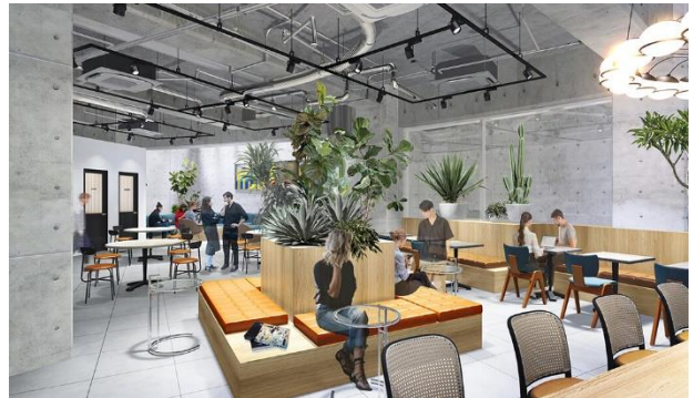
▲RESIDENTIAL LOUNGE イメージ