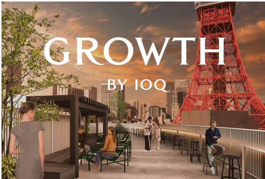
▲GROWTH BY IOQ ROOF TOP イメージ