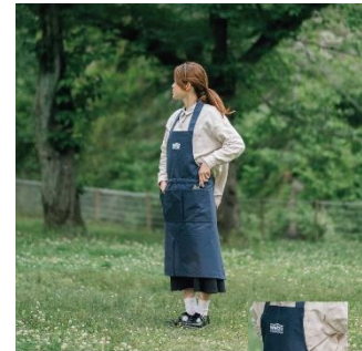
福岡市認知症フレンドリーシティプロジェクト 結ばなくていい ガーデニングエプロン