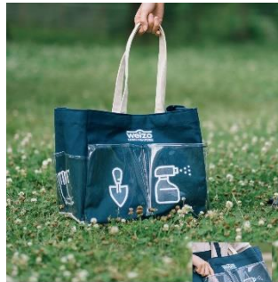
福岡市認知症フレンドリーシティプロジェクト モノが無くならない ガーデニングトートバッグ