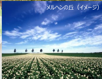
メルヘンの丘 (イメージ)