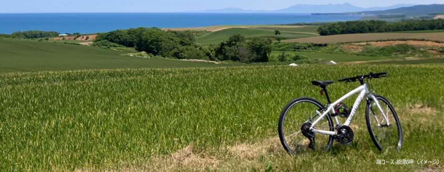
海コース 能取岬 (イメージ)