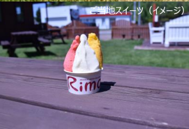
ご当地スイーツ (イメージ)