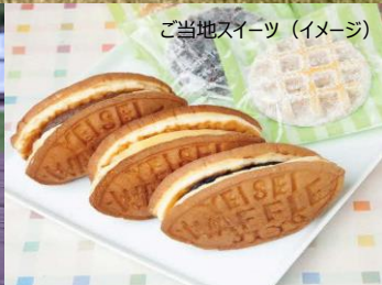
ご当地スイーツ (イメージ)