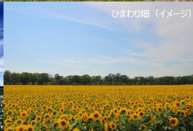
ひまわり畑 (イメージ)