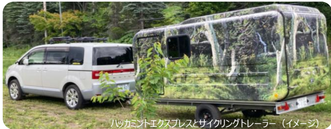
ハッカミントエクスプレスとサイクリングトレーラー (イメージ)

当ツアーは東武トップツアーズ株式会社の主催旅行です。詳細は右記QRコードにてご確認ください。