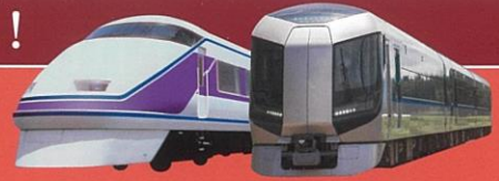
スーパーシア [復路] (イメージ)