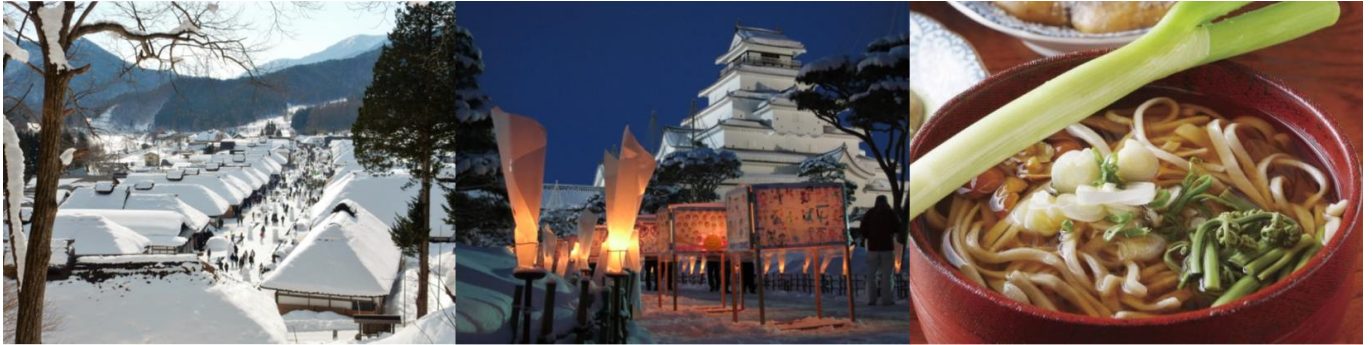
(写真左より) 大内宿、会津絵ろうそくまつり、ねぎそば (イメージ)