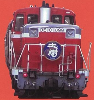
DL 大樹 (色が変わる場合がございます)

会津冬の魅力、会津絵ろうそくまつりと大内宿の雪景色 をご案内します。復路に DL 大樹で会津田島→下今市乗車 ・ノスタルジックな夜汽車気分をお楽しみ下さい。