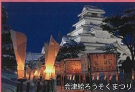
会津絵ろうそくまつり