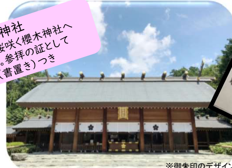
※御朱印のデザインは変更になる場合があります。

櫻木神社 野田市最古の桜咲く櫻木神社へ ご案内します。参拝の証として 御朱印(書置き)つき