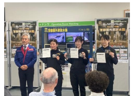
「防災コンシェルジュ」認定式の様子

デモツアーは 3 月 26 日（火）に実施され、10 社 14 名のマスコミ関係者の方々にご参加いただき、すでに公開している全体的見学箇所に加え、今回初公開となる第 3 立坑および地下トンネルの見学を行いました。また、ツアー開始に先立ち「防災コンシェルジュ」認定式が行われ、ツアーの案内を行う当社職員 11 名が「防災コンシェルジュ」に認定されました。