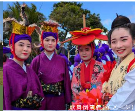
歌舞団演者(イメージ)