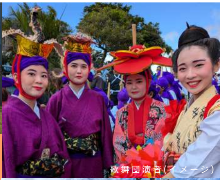
歌舞団演者(イメージ)