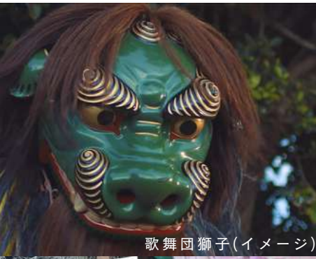
歌舞団獅子(イメージ)