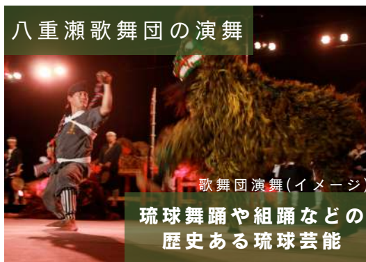
八重瀬歌舞団の演舞