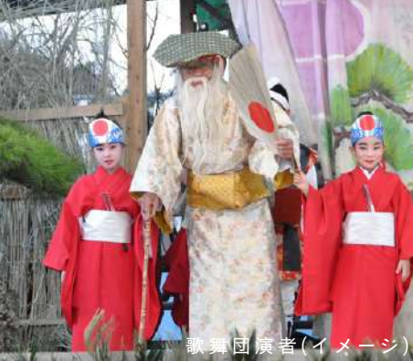
歌舞団演者(イメージ)