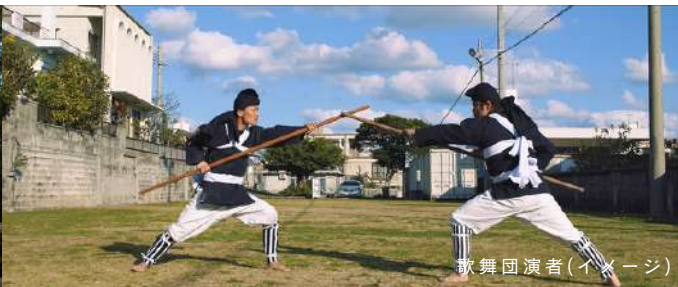
歌舞団演者(イメージ)