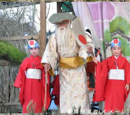
歌舞団演者(イメージ)