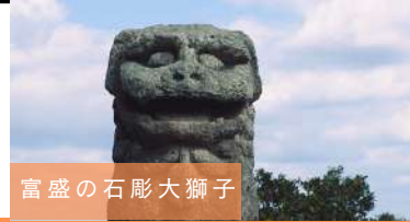
富盛の石彫大獅子

旅行条件＜要約＞ 詳しい旅行条件を説明した書面をお渡しいたしますので、事前にご確認の上お申込みください。本旅行条件書は、旅行業法第12条の4に定める取引条件説明書面及び同法第12条の5に定める契約書面の一部となります。この条件に定めのない事項は、当社旅行業約款（募集型企画旅行契約の部）によります。当社旅行業約款は当社ホームページからご覧いただけます。