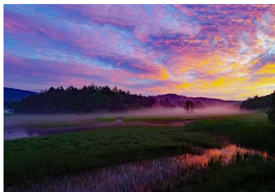
「尾瀬沼の夜明け」（撮影場所：尾瀬沼） （ふくしま尾瀬フォト&ムービーコンテスト 2023 受賞作品）

https://www.tobutoptours.co.jp/ TOBU TOP TOURS CO.,LTD.