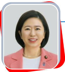
国際博覧会担当大臣 自見 はなこ (じみ はなこ)

内閣府特命担当大臣（沖縄及び北方対策、消費者及び食品安全、地方創生、アイヌ施策）、国際博覧会担当大臣。認定内科医、小児科専門医。