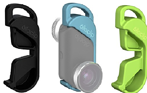
3色のペンダント型ホルダー付

→販売サイトはこちらから http://www.qlix.jp/olloclip