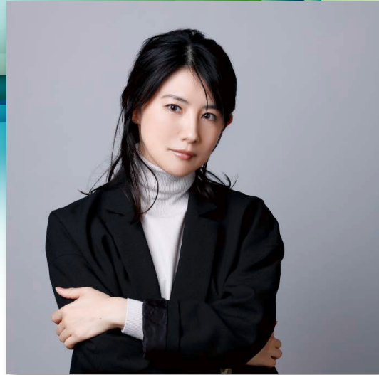
中江 有里さん 女優・作家・歌手