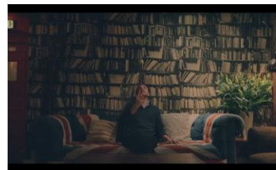
参考画像:ムービーイメージ