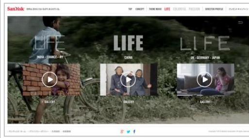
参考画像:スペシャルサイトイメージ