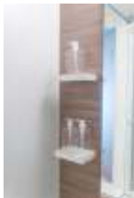
洗面や浴室は、PET 詰替ボトルを並べました。

360°Cパノラマ画像 http://www.sotetsu-re.co.jp/ups/bunjo/panorama.asp?pm_bid=1323