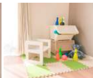
インテリアキャリコ