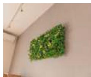
DIYしたグリーンオブジェ