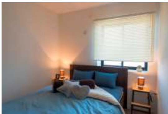
寝室(洋室:約6帖)には、中央にベッドを配置。