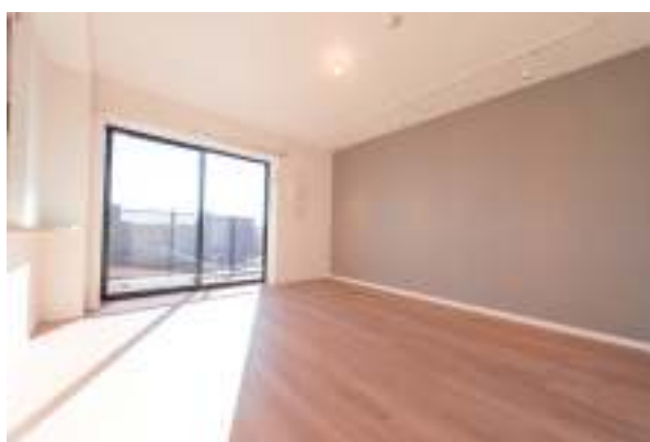
リビングダイニング(約10.2帖) BEFORE

洋室(約4帖)は、壁面にオリジナル本棚を並べ、窓面のサイズでDIYしたデスクを設置し、書斎としてコーディネートしました。小さめのスペースでも壁面に沿ってアイテムを設置することで、整然とした空間が生まれました。