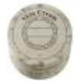
シアバター配合 スキンクリーム