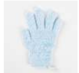
肌ざわりソフトな浴用手袋