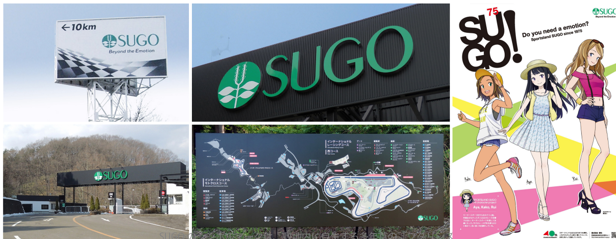
SUGO のシンボルマークは、敷地内に自生する多年草の「フタリシズカ」がモチーフになっています