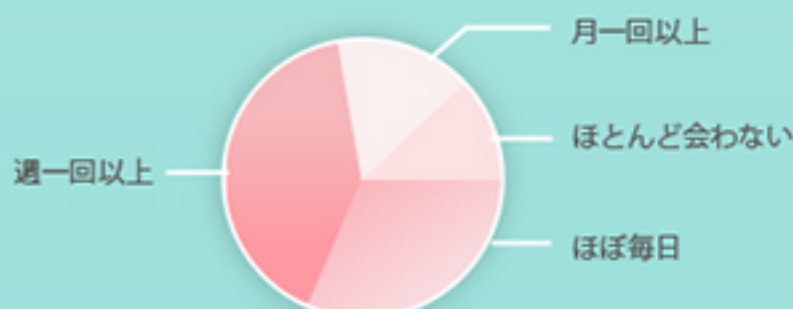
Between カップルの会う平均回数

チャットしたり、アルバム見たりすればやっぱり会いたくなる。。オンラインでの愛情表現がオフラインの関係をもっと豊かに♡カップル専用アプリのおかげで二人の距離はもっと縮まる! このアプリはパートナーとしか使えないので、ちょっぴりモテすぎた彼氏も一途になってくれたとか。デートの予定や思い出を共有して、パートナーをメロメロにしちゃおう♥