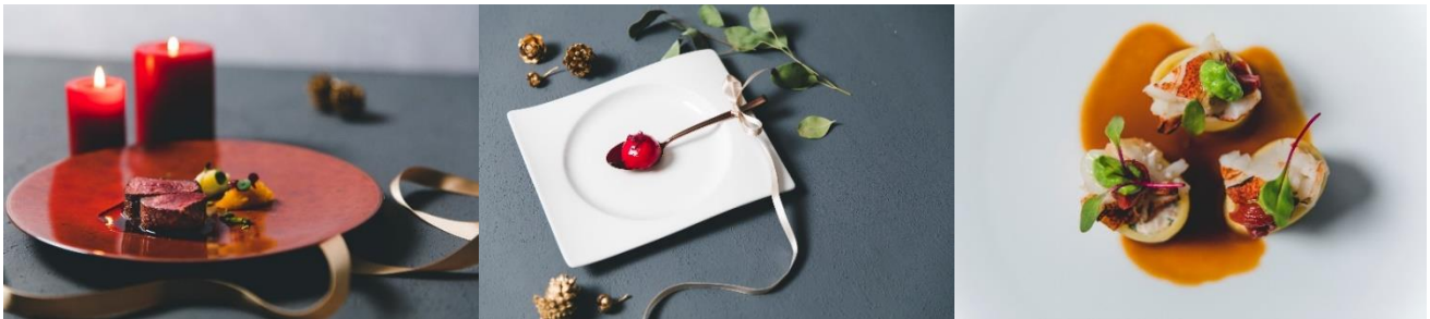
Christmas ディナー イメージ

パルマ産生ハムと葱のグリッシーニ／鰯とホタテの軽いマリネ オレンジ風味 カリフラワーのピューレとともに／ タコのルチアーナ風フリット 黒オリーブのソース／オマール海老とリコッタチーズのカネロニ仕立て アメリケーヌソース／ ヘルシークイーンビーフ ファイルのロースト 赤ワインソース／エシレバターのカチョ・エ・ペペ スパゲッティーニ／ クリスマスドルチェ／コーヒーまたは紅茶