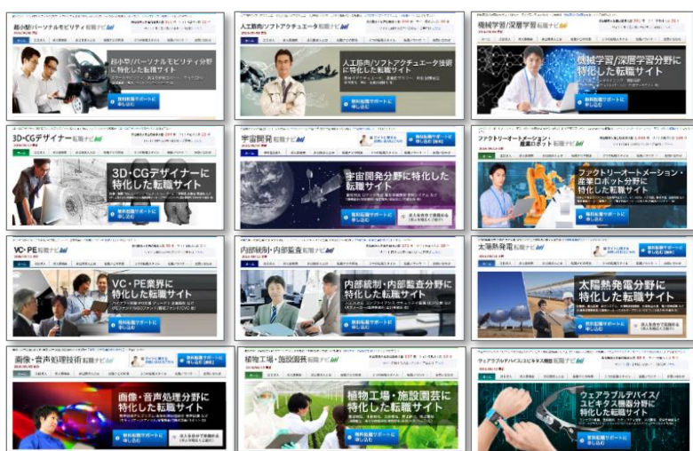
『転職ナビ』サイト一例

世界80カ国の新事業/新技術/新製品、投資情報データの分析により、有望成長市場に特化した採用支援サイト約400種類を展開しています。エネルギーやモビリティ、情報通信、エレクトロニクスといった成長領域を網羅し、研究者/技術者を中心に年間約630万UUのサイト訪問と約5万人の登録者を獲得しています。