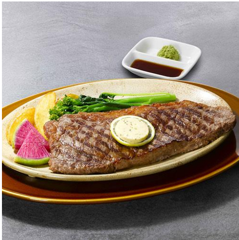
“ロイヤル”サーロインステーキ 250g