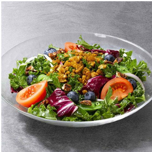
“ロイヤル”ケールサラダ