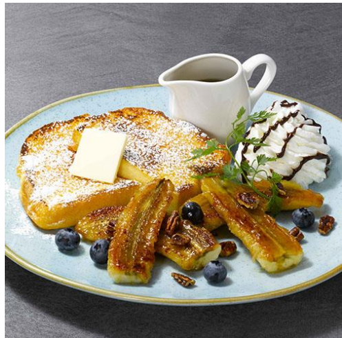
フレンチトースト～バナナキャラメリゼ～