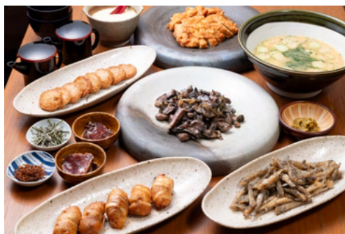
宮崎郷土料理（イメージ）