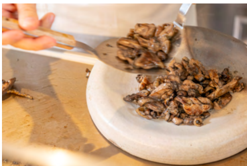
鶏の炭火焼き（イメージ）