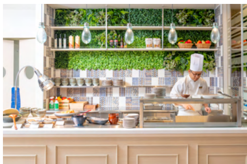
ライブキッチン（イメージ）