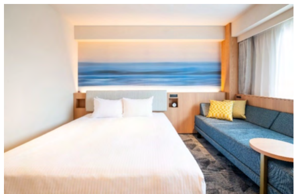
デラックスダブルルーム