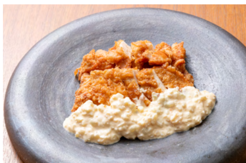
チキン南蛮（イメージ）