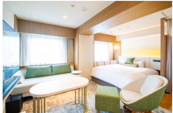
日向（ひなた）～HINATA precious room～