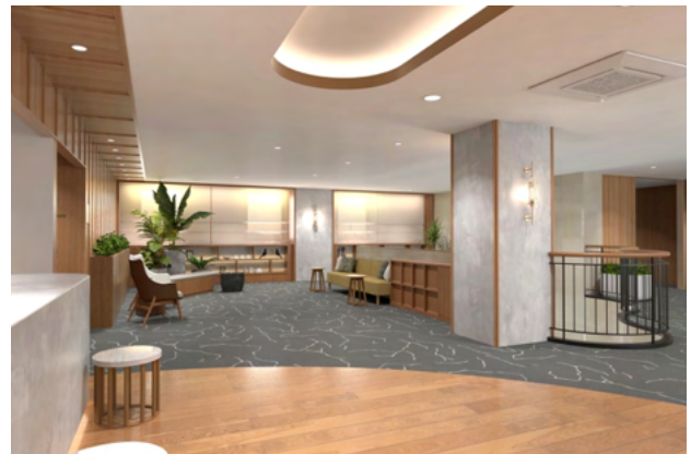
リッチモンドホテル宮崎駅前 ロビー（イメージ）