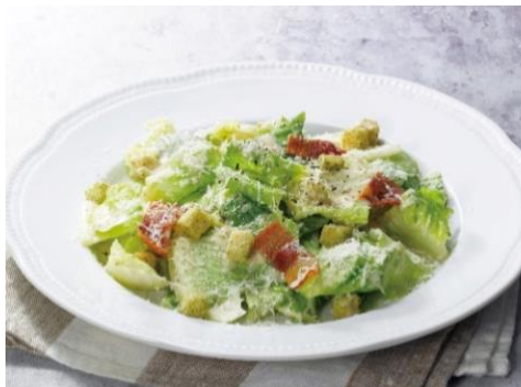
ロメインレタスのシーザーサラダ 730円（税込 803円）

ロメインレタス、パルミジャーノレッジャーノチーズ、クルトンをシーザードレッシングで和え、カリッと焼いたベーコンをのせ、更にパルミジャーノレッジャーノチーズをかけて仕上げます。ロメインレタスの葉は厚みがあり、濃厚なチーズの味わいにもよく合います。