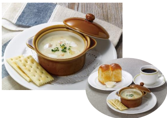
ニューイングランドクラムチャウダー 単品：630円（税込 693円）

ハーブとスパイスが香るフィンガーチキンと、衣にビールを使用したオニオンリングのフライ、フライドポテトを盛り合わせたアベタイザー。マヨネーズやケチャップ、スパイスなどを合わせたディップソースにつけてお召し上がりください。