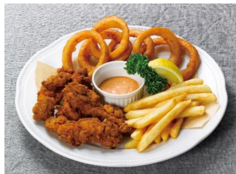
フィンガーチキン&オニオンリング 1,230円（税込 1,353円）

ロメインレタス、パルミジャーノレッジャーノチーズ、クルトンをシーザードレッシングで和え、カリッと焼いたベーコンをのせ、更にパルミジャーノレッジャーノチーズをかけて仕上げます。ロメインレタスの葉は厚みがあり、濃厚なチーズの味わいにもよく合います。