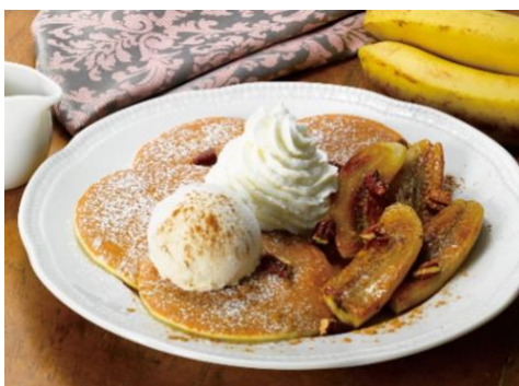
キャラメリゼバナナパンケーキ 1,230円（税込 1,353円）

小さめのパンケーキ（5枚）をバターソテーしキャラメリゼしたバナナ、バニラアイスクリームと組み合わせたボリュームたっぷりのデザート。甘くてほろ苦いバナナとシナモン、パンケーキの相性は抜群です。トロツと温かいシロップは香りが立ってパンケーキにも良く馴染み、更に美味しく召し上がりいただけます。