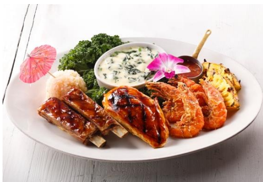
アイランドプラッター

サラダバー2名様分付 15,290円（税込 16,819円） サラダバー3名様分付 17,490円（税込 19,239円） サラダバー4名様分付 19,690円（税込 21,659円）