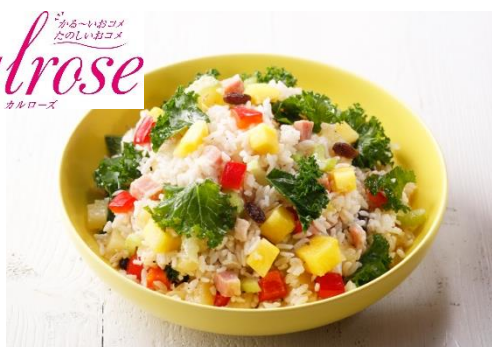
ハワイアンライスサラダ

冷たくしても美味しく軽やかな食感のカリフォルニア産「カルローズ米」を使用したライスサラダ。カルローズ米に、ベーコン、パイナップル、パプリカ、セロリ、レーズン、ケール、オニオンダイスを合わせ、ビネガー風味でライトに仕上げました。