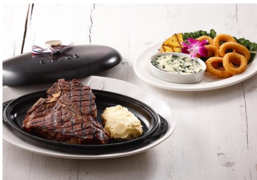
ポーターハウスステーキ

厚切りで食べ応えあるポーターハウスステーキ。付け合わせは、本場ハワイのステーキハウスにならい、クリームスピナッチとマッシュポテトを添えました。柔らかなフィレと豊かな味わいのサーロインをお楽しみください。