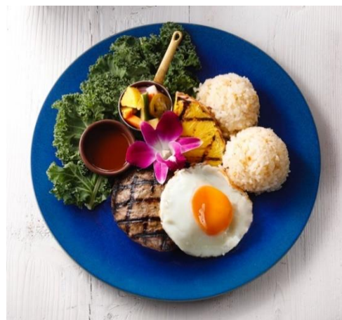
ロコモコプレート