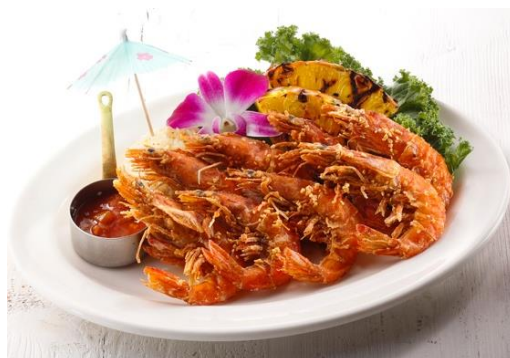
ガーリックシュリンプ

サラダバー1名様分付 6,980円（税込 7,678円） サラダバー2名様分付 9,180円（税込 10,098円） サラダバー3名様分付 11,380円（税込 12,518円）