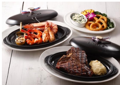
パシフィックオーシャン サーフ&ターフ

サラダバー1名様分付 9,091円（税込 10,000円） サラダバー2名様分付 11,291円（税込 12,420円） サラダバー3名様分付 13,491円（税込 14,840円） サラダバー4名様分付 15,691円（税込 17,260円）