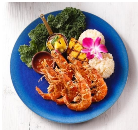
ガーリックシュリンププレート