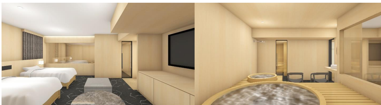
「Spa プレミアツインベッドルーム」

かつての隅田川沿いには宿場が軒を連ねており、旅人たちの宿や休憩処となっていました。そこで、リッチモンドホテル全体を現代の宿場として捉えて、6階にはサウナルームを完備し、「癒」の休憩処を提供します。フロアコンセプトは“湯屋”で、4つの部屋タイプを用意しています。