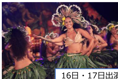
16日・17日出演(ダンスショー)