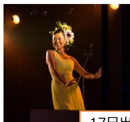
17日出演(ダンスショー)