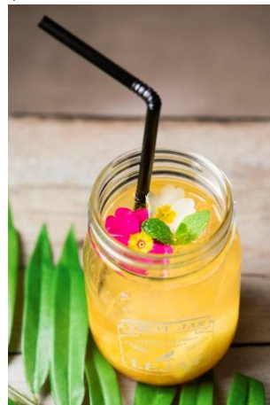
◆AROUND TABLE (1F) トロピカルマンゴーソーダ 604円