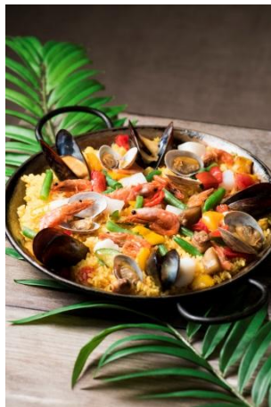
◆portofino (2F) パエリア ※ビュッフェ代に含む