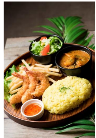
◆インドカレーダイニング コバラハッタ (3F) ココナッツシュリンプ カレープレート 1,080円 ※表示価格は全て税込みとなります