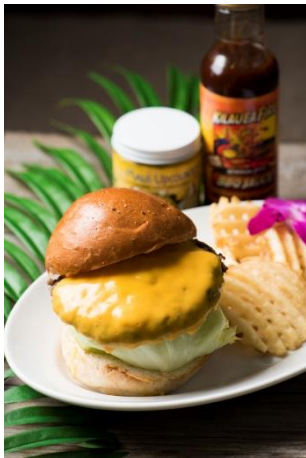
◆STEAK & CAFE by DexeeDiner (2F) ハワイアンバーガー 1,400円