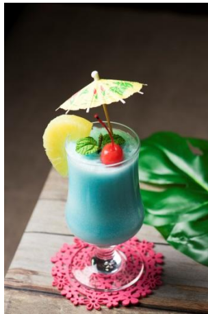
◆ルビーカフェ (3F) ブルーハワイスムージー 800円