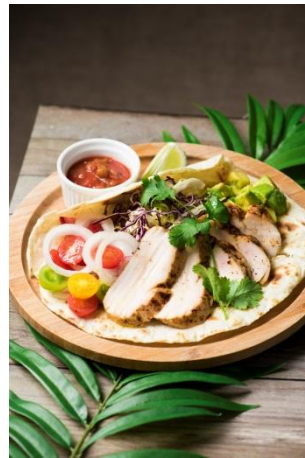
◆パドリーノ・ デル・ショーザン (2F) カラフル野菜の メキシカンラップ 1,280円