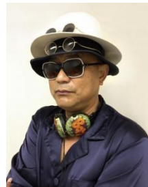
〈ゲスト〉 ブラザートム