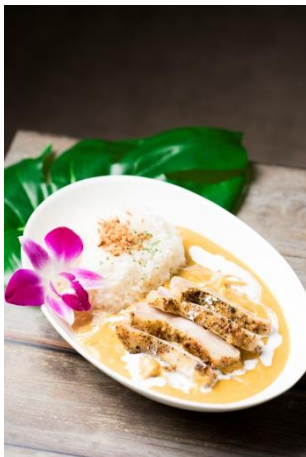
◆チロリカフェ (1F) ハワイアンココナッツカレー 1,100円