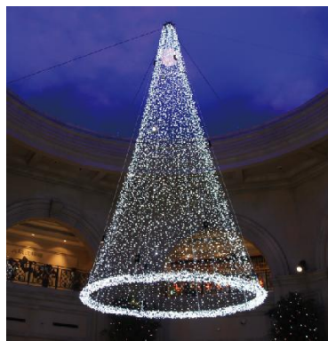
Spes's White tree A (希望のツリー)