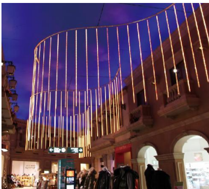
An aurora curtain (オーロラ・カーテン)