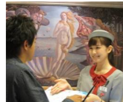
館内をアattendするクルーやインフォメーションは英・中・韓に言語対応