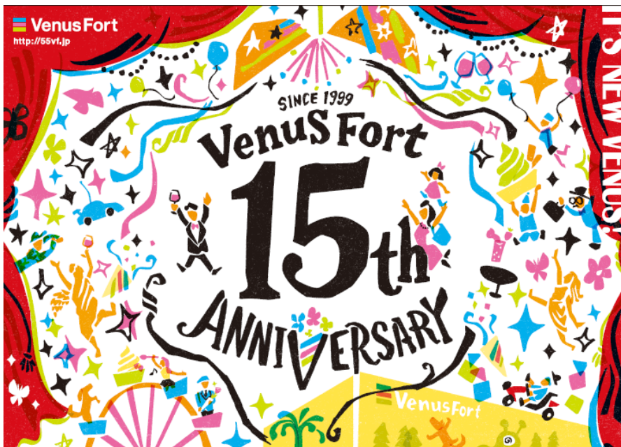
15周年アニバーサリーのメインビジュアル

9月27日(土)から10月13日(月)の期間を“アニバーサリーウィーク”とし、様々なイベントを実施いたします。また、リニューアルオープンお披露目の日となる9月27日(土)には、スペシャルパーティを開催いたします。