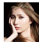
ARTIST LIVE 14:00~ サラ・オレイン ※どなた様でも ご自由にご覧 頂けます。