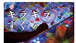
遊び心溢れる「オシャレ縁日」