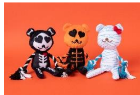
★ジョーカーズタウン [1F] 犬用おもちゃ 各1,980円(税込) ハロウィン仕様の可愛い犬用おもちゃです。腕がローブになっているので遊びごたえ抜群！