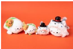
★マザーガーデン おもちゃの森 [1F] しろたんハロウィンかぼちゃ王様ちびマスコット/ハロウィン狼ちびマスコット 各1,738円(税込) 毎年人気のハロウィン変身シリーズに今年はかぼちゃ王子と狼が登場！