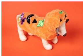
★PET PARADISE [1F] ペットパラダイスかぼちゃベスト 2,916円(税込)～ 毎年人気のなりきりシリーズが今年も登場します。 ※3S～Sサイズをご用意。