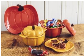
★スタディオクリップ [2F] ポット 各1,430円(税込) プレート S: 660円(税込) M: 1,100円(税込) お洒落なかぼちゃのプレートやポットでハロウィンをお楽しみください。

ハロウィンで定番の仮装にぴったりのアイテムや、お家でもハロウィンを感じられる様々なグッズをはじめ、ペット用の仮装アイテムやおもちゃもご用意。お子様からペットまで楽しめるハロウィンアイテムに、ご注目ください。 ※表記の金額は全て税込価格(10%)です。