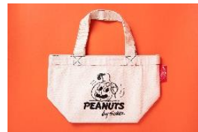
★POLESIE STORE [1F] ランチトート 1,980円(税込) スヌーピーのハロウィン限定トートバック。キャンパス地で使いやすい大きさが魅力です。