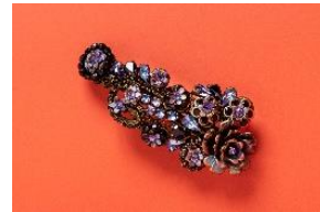
★ミハエル ネグリン [2F] レースヘアパレッタ 31,680円(税込) ハロウィンコスチュームにおすすめの、ミステリアスなカラーです。