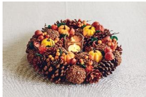
★スタディオクリップ [2F] かぼちゃリースM 2,420円(税込) お部屋でもハロウィン気分を満喫できるお洒落なかぼちゃのリースです。