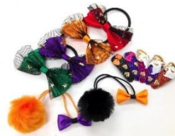
★キディランド [2F] ハロウィンヘアアクセサリ 330円(税込)～ リボンやおぼけモチーフが可愛い、ハロウィンカラーのヘアアクセサリです。