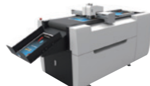
シール用ハーフカット