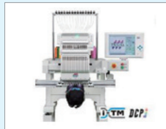
中日本ジューキ株式会社 タジマ刺繍機「TMEZ-S1501C (360×500)S」