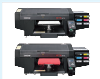
三菱王子紙販売株式会社 ブラザーガーメントプリンター「GTX-423」