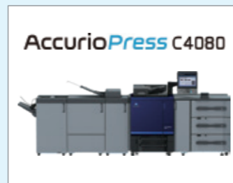
コニカミノルタジャパン株式会社 プロダクション&グラフィックプリンター 「AccurioPressC4080」