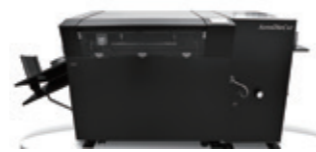
型抜き加工(折筋も同時設定)