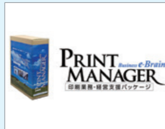
株式会社ビジネスイーブレーション 印刷情報管理システム「PRINTMANAGER」