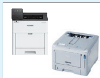
株式会社グラフィックサポート A3カラー複合機「ApeosPortPrint C5570」 (グラフィックサポート特別仕様機) A4単板名刺レーザープリンタ「CardImpactCube」