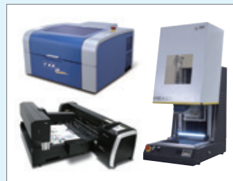
コムネット株式会社 プロッターレーザー加工機「GCC C180II」 ガルバノ式レーザー加工機「SEI EASY」 自動給紙機能付きプロッター「GCC RXII」