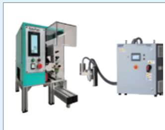
ナビタスマシナリー株式会社 パッド印刷機「SMART PAD」 プラスマ処理機「プラスマダイナ 1000Rpro」