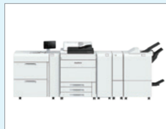
富士フイルムビジネスソリューションズ株 プロダクションプリンター「RevoriaPressSC180」 (エアークッション、中綴じ)