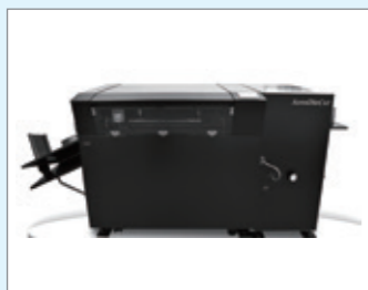
株式会社ウチダテクノ カッター&クリーナー「AeroDieCut」