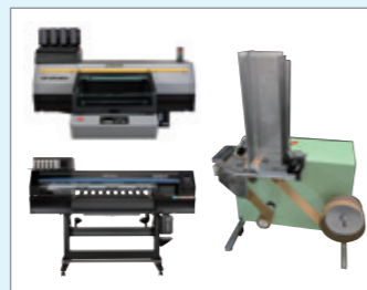
株式会社ミマキエンジニアリング UVフラットベツトプリンター「UJF-6042MkIIe」 DTFプリンター「TxF150-75」