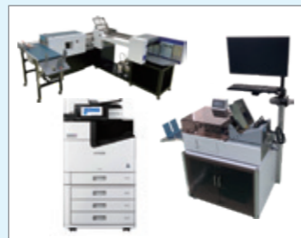
デュプロ販売株式会社 フチ糊DM圧着機「GS-L800」 封筒印刷システム「YJ-10050」 宛名検査装置「CI-200T」