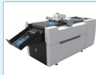
株式会社ヨテック 自動給紙カッティングプロッター「DG-5070Plus」