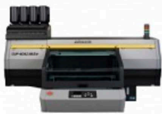
UJF-6042 MkII e