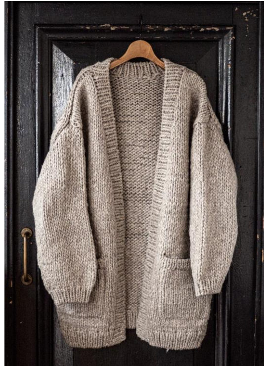
ペルーハンドニットロングカーディガン ( Beige , Black ) ¥35,200 (税込)

コートの変りになるほどのビッグサイズのカーディガンです。太い糸の存在感はそのままに天竺編みのボディに、襟から前立てにかけてリブ編みをアクセントにしたデザインになります。着用感は、見た目ほどの重たさはなく、そのためリラックスして体を温めたい部屋スタイルのカーディガンとしても、また外出時のアウター役としても着まわせる一着です。