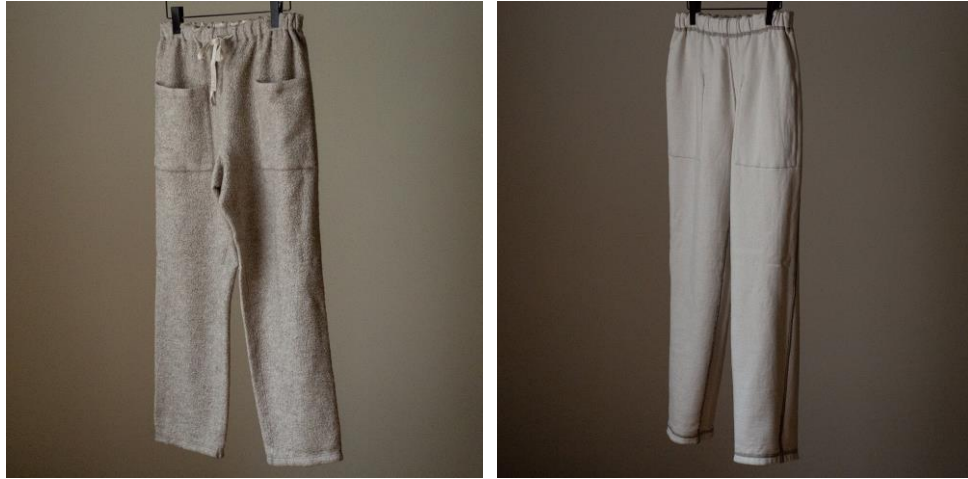
コットンヤクナッピングリバーシブルプルオーバー ( Beige ) / ¥23,100 (税込) コットンヤクナッピングリバーシブルパンツ( Beige ) / ¥24,200 (税込)