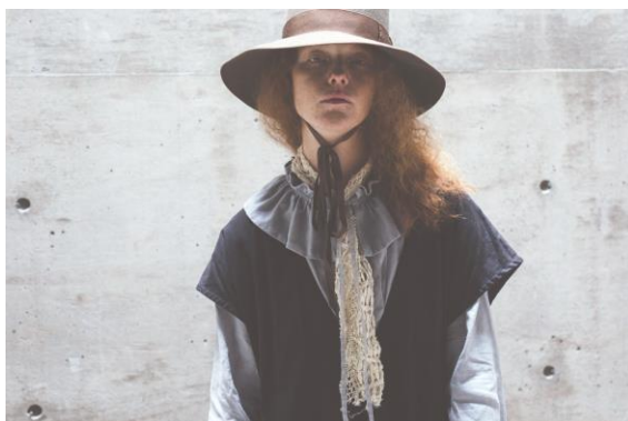
UpcycleLino ruffle collar blouse (アップサイクルリノ ラッフルカラーブラウス)

https://store.nestrobe.com/nestrobe/itemdetail?ItemID=01213-1035&sci=26