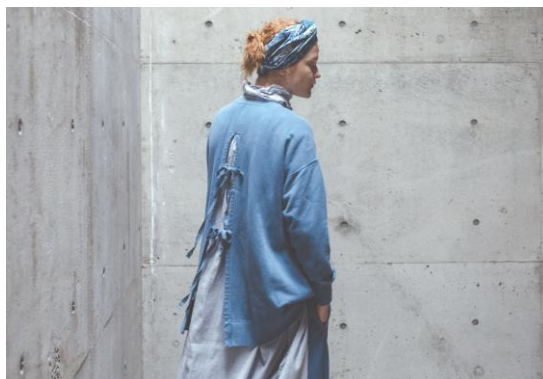
UpcycleLino ribbed back long pullover (アップサイクルリノ リボンバックロングプルオーバー)

https://store.nestrobe.com/nestrobe/itemdetail?ItemID=01213-1040&sci=22