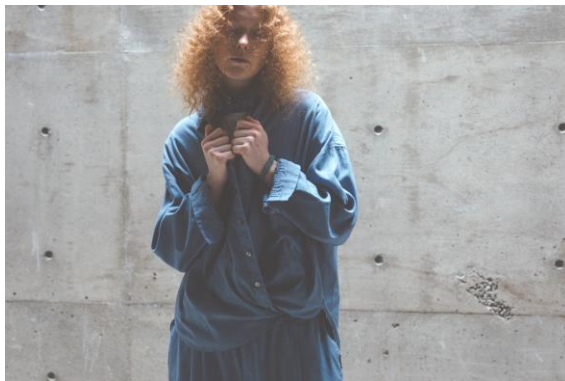
UpcycleLino shirt jacket (アップサイクルリノ シャツジャケット)

https://store.nestrobe.com/nestrobe/itemdetail?ItemID=01213-1024&sci=57