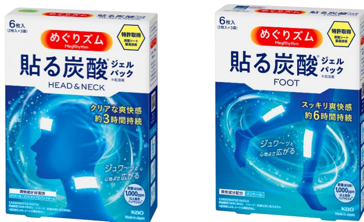
左から、『めぐリズム 貼る炭酸*1ジェルパック HEAD&NECK』『めぐリズム 貼る炭酸*1ジェルパック FOOT』

花王株式会社(社長・長谷部佳宏)は、2025年3月29日、「めぐリズム」から、日本で唯一となる炭酸*1配合ジェルパック「めぐリズム 貼る炭酸*1シリーズ」を発売します。花王は、本商品の発売により、新しいリフレッシュ習慣をご提案します。