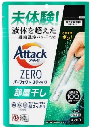
『アタック ZERO パーフェクトスティック 部屋干し 7本入り』