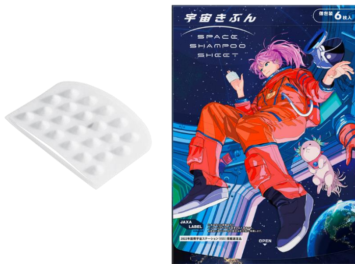
「宇宙きぶん スペースシャンプーシート」左から、商品本体、商品パッケージ

*1「楽天市場」の出店店舗が、新商品や増産前の商品などを企画ページで販売するしくみ