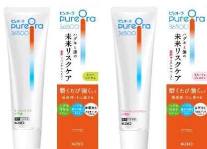
左から PureOra36500 薬用マルチペースト【医薬部外品】 ・ミントシトラス (販売名:ピュオーラ Vb1) ・フルーティジャスミン (販売名:ピュオーラ Vb2)