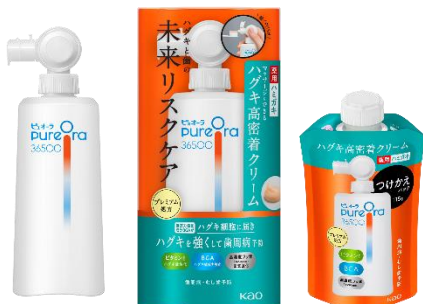
PureOra36500 薬用ハグキ高密着クリームハミガキ【医薬部外品】 (販売名:ピュオーラ CV)