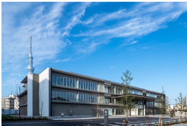
iU情報経営イノベーション専門職大学