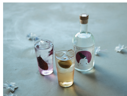
(左) 赤紫蘇ジンソーダ

※茶寮の営業時間：15:00～18:00(17:30L.O) 左記営業時間外21:00～23:30は客室へお届けいたします。