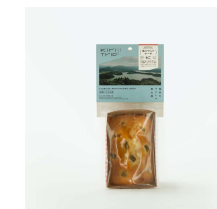
梅パウンドケーキ