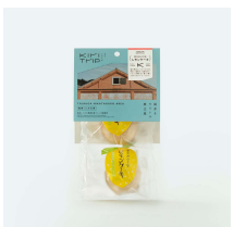
幸せの小さな レモンケーキ