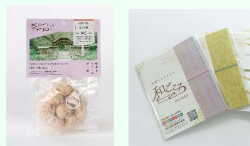
キリトリップどれか1商品 と越前和紙マスクケースのセット 10名様