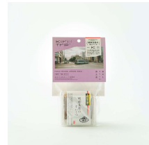
胡麻豆腐のすいーつ