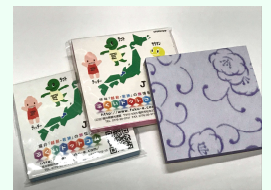
越前和紙メモパッド