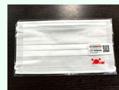
マスク (かにシールつき) と越前和紙マスクケースのセット 30名様