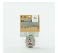
梅たっぷりゼリー

福井県の最も南西部、美しい海や山に囲まれた自然豊かな地域。さまざまなアクティビティを楽しめるだけでなく、古代から都の食文化を支えてきた歴史や若狭塗箸などの伝統工芸もあり、受け継がれてきた文化が今も息づいています。