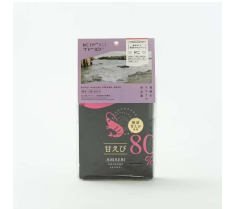
越前甘えび唐揚げせんべい