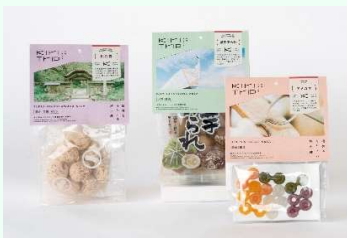
キリトリップどれか3商品 5名様