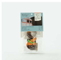
敦賀しよころオレンジ