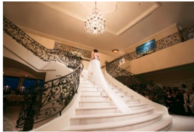
▲美しいバックスタイルに、誰もが魅了されました