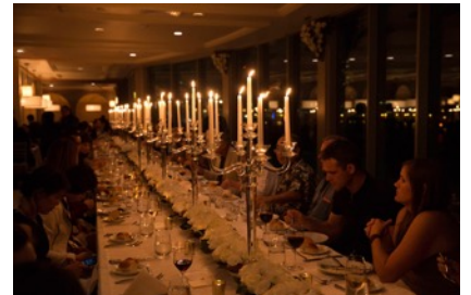
▲この日のために用意した53 By The Seaのスペシャルコースをご堪能いただきました