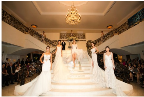
▲Galia Lahavのドレス17着をお披露目しました