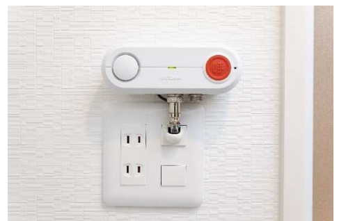
脱衣室のナースコール