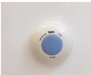
浴室見守りセンサースイッチ