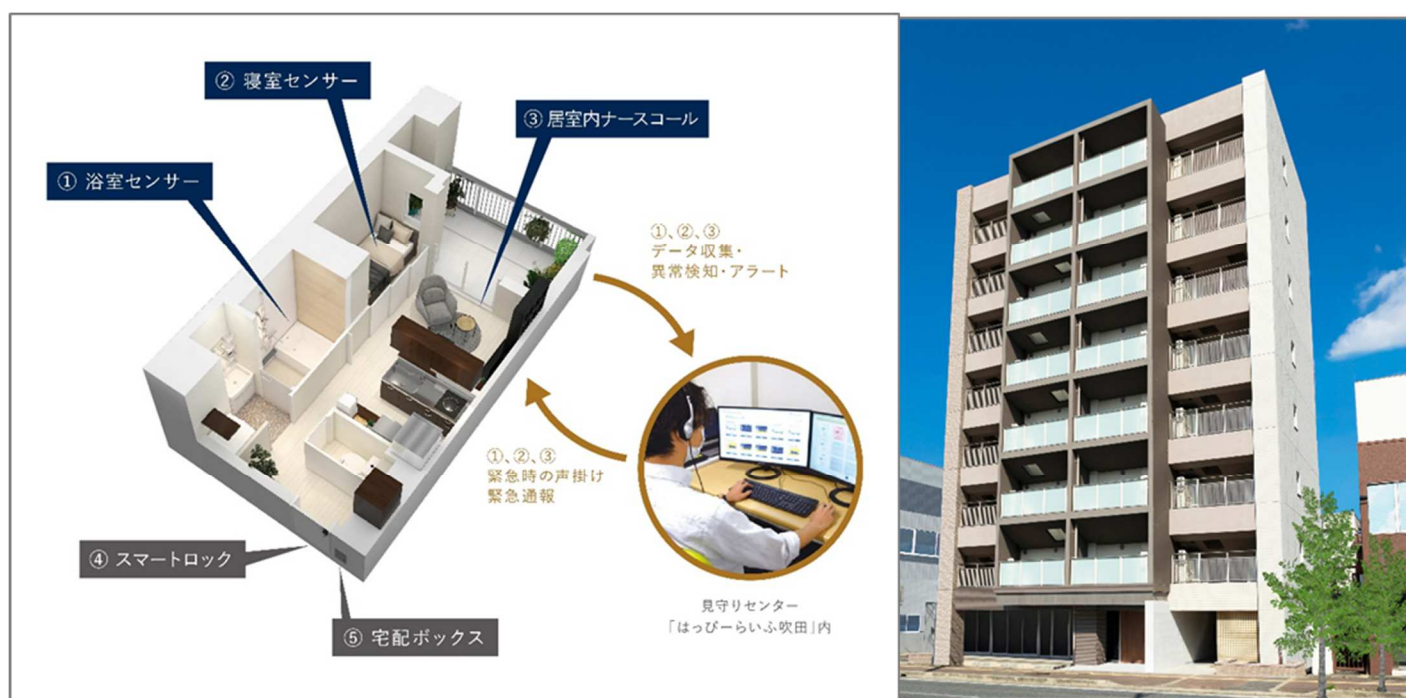
見守りシステム全体像