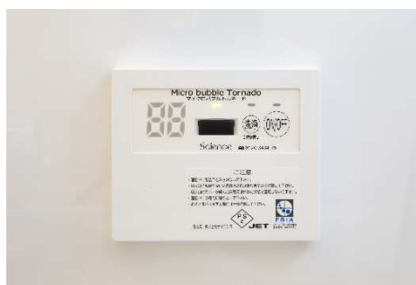
ファインバブルで入浴できます