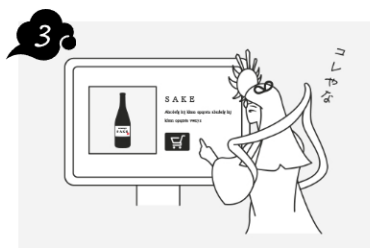
専用サイトで購入