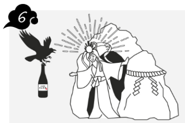
渾身の1本が手もとに届く