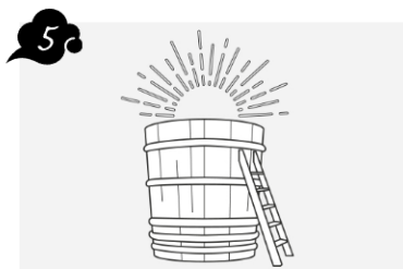
酒が完成、酒蔵による貯蔵