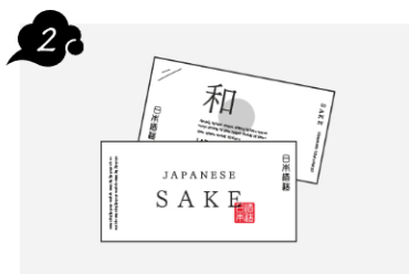
デジタルラベル®販売開始