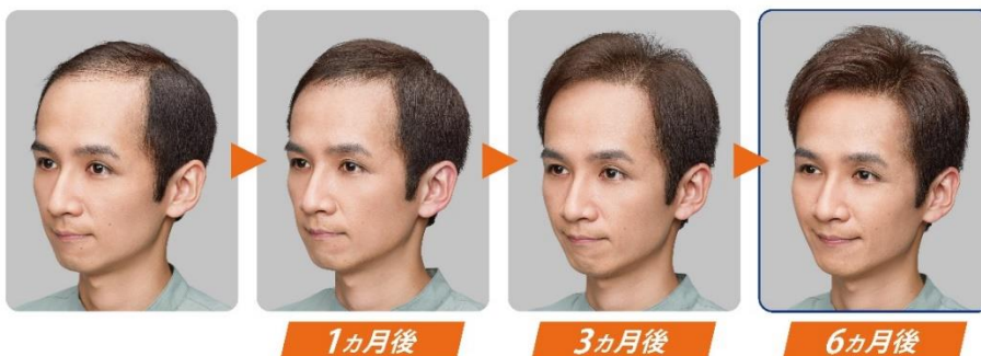
※段階増毛イメージ例

髪の状態に合わせて気になる箇所を段階的にかつ自然に増やせるので、お客様一人ひとりの理想の増毛が実現します。