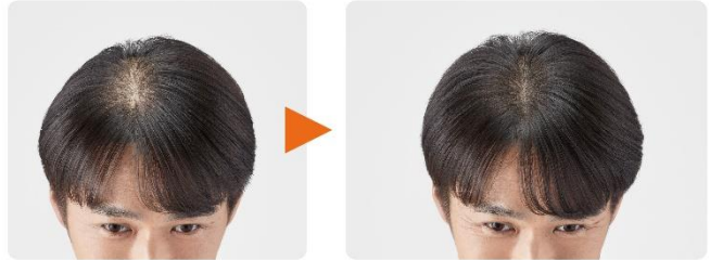
【60 分で増毛した一例】