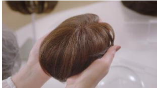
高泉さん:うわあこんなに軽いんだ…