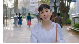
高泉さん:でも、実物触ったことないし、よく分からないのよね…