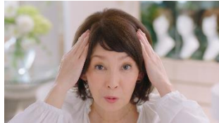
高泉さん:サツとのせてキュッキュ!