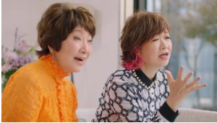
清水さん:でも、うまくつけられるかな…