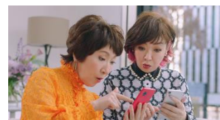
森山さん:あら、ご近所!