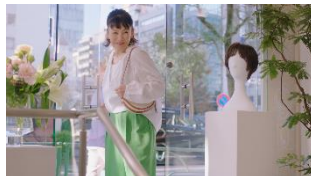
森山さん off:ふらっと入って