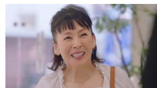
高泉さん:見せてもらってもいいですか? 店員:どうぞ