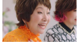
森山さん:だったら、試着しちゃって!