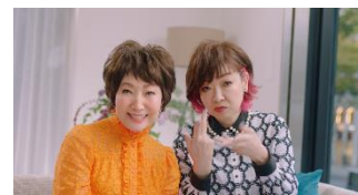
森山さん:突然の試着も大歓迎!