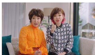
森山さん:じゃあ、ふらっと見に行っちゃえば 清水さん:予約なしで!