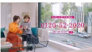
NA:お近くのレディースアートネイチャーの お店を検索