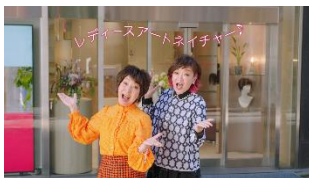
おふたり:レディースアートネイチャー♪